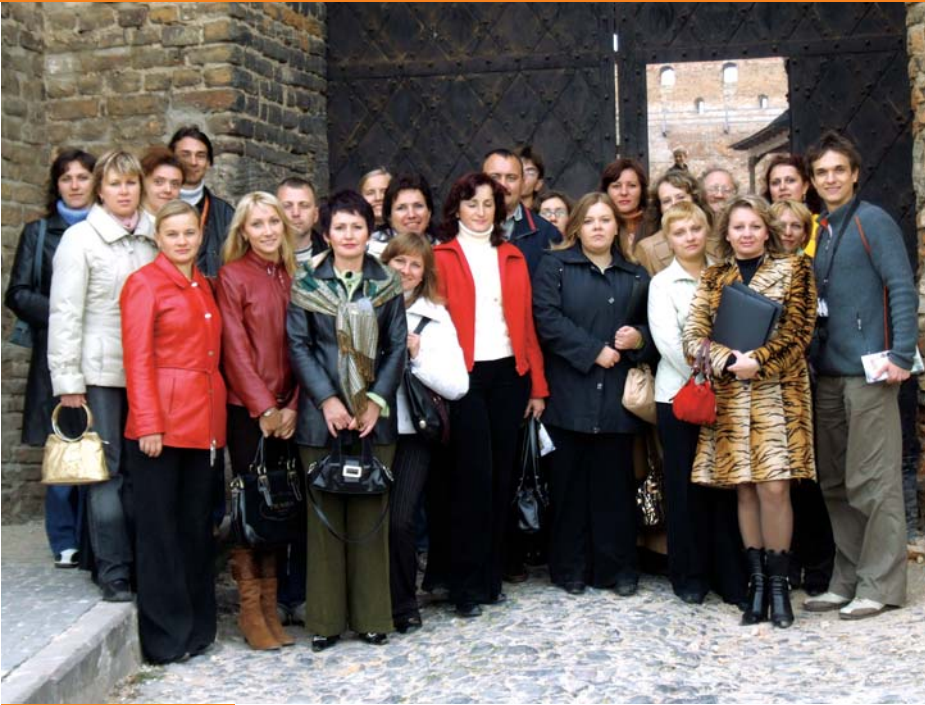
Учасники проекту YES.

Створення нових освітніх можливостей для молоді в Україні та налагодження співпраці між молодими людьми в сусідніх державах України та Польщі є тими викликами, які приймають на себе неурядові організації Європейський Дім Зустрічей - Фондація Новий Став з Любліна та Центр Молодіжних Організацій Волині "Наша Справа" з міста Луцька.